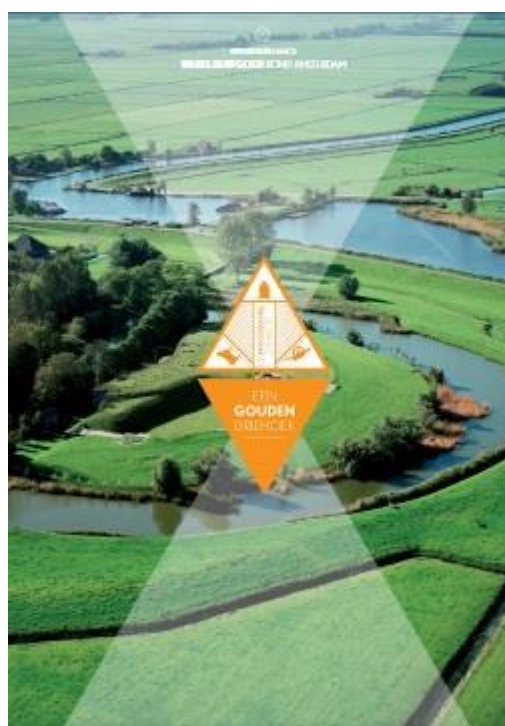
Twee voorbeelden van routeboekjes, gemaakt door de stichting: Koninklijke routes in Noord-Holland, in het kader van 200 jaar Koninkrijk, en Een Gouden Driehoek, over Noord-Hollands Werelderfgoed.

Hiervoor zou landelijke opschaling van zowel content als techniek van belang zijn, schreef Oneindig Noord-Holland in het meerjarenplan van 2012. Omdat er geen partij opstond die daartoe geëquipeerd bleek, heeft Oneindig Noord-Holland het initiatief genomen om dat zelf te doen via het nationale platform INNL.nl. Op INNL.nl is nationale content over erfgoed te vinden. Deze heeft stichting Oneindig Noord-Holland overgenomen van het ooit in oprichting zijnde Nationaal Historisch Museum. Door deze overname is Oneindig Noord-Holland toegetreden tot de kerngroep van het nationale Netwerk Digitaal Erfgoed en partner geworden van de Maand van de Geschiedenis.