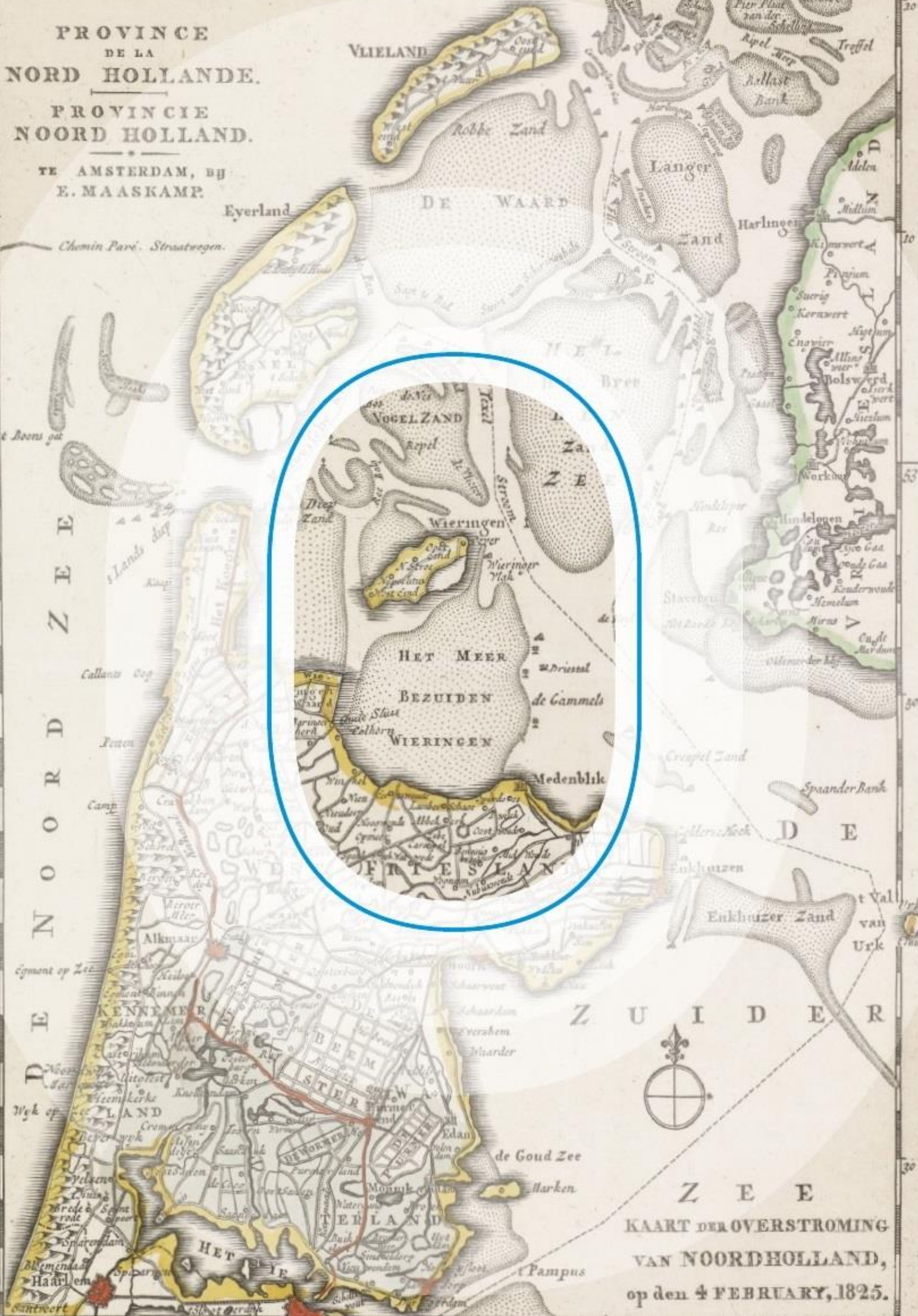
KAART DER OVERSTROMING VAN NOORDHOLLAND, op den 4 FEBRUARY, 1825.