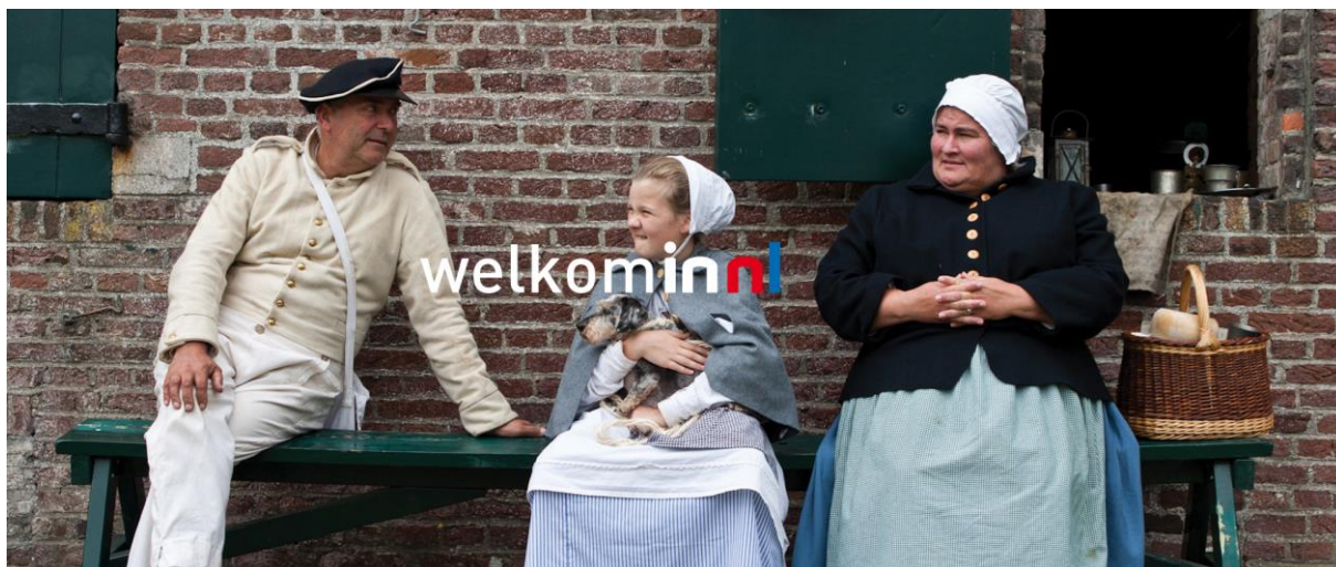
Een van de banners van het platform INNL.

Wat voorheen wel succesvol was, was het verwerven van financiële bijdragen van gemeenten en erfgoedinstellingen. Vanaf 2015 zijn de activiteiten op dat terrein minder geweest. 1 Oneindig Noord-Holland zal zich in deze beleidsperiode met hernieuwde kracht inzetten om financiële bijdragen van gemeenten en erfgoedinstellingen te verwerven. Het is hierbij zaak om de verschillende partners te differentiëren en in kaart te brengen hoe ze structureel aan de stichting zijn te binden. Oneindig Noord-Holland kan aan gemeenten en erfgoedinstellingen tegen betaling van financiële en niet-financiële bijdragen producten aanbieden waarmee zij hun aantrekkingskracht op het gebied van cultuurhistorie kunnen vergroten. Hier zal de stichting sterk op inzetten. Dit wordt verder toegelicht in dit plan vanaf het onderdeel 'Oneindig Noord-Holland in 2020'.